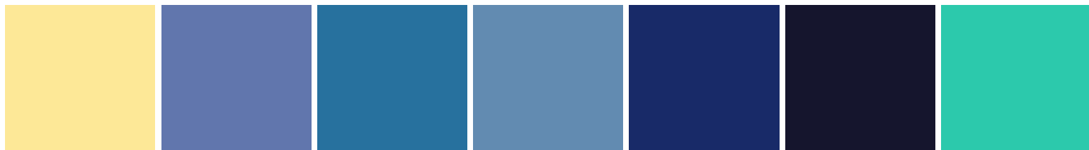
ΚΙΤΡΙΝΟ ΠΑΛ 107

65% πολυέστερ 35% βαμβάκι, βάρους 140-150 γρ/μ 2